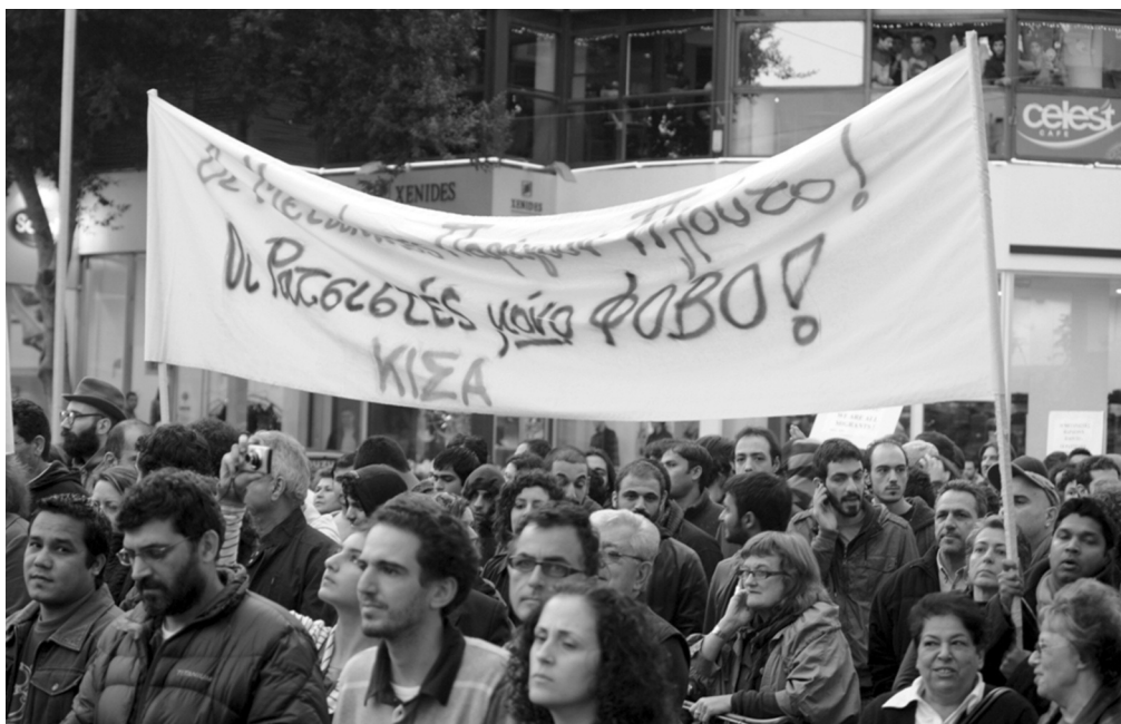
Οι μετανάστες παράγουν πλούτο! Οι ρατσιστές μόνο φόβο! ΚΙΣΑ

Οι φασίστες δηλώνουν ότι δεν θα σταματήσουν. Κι ούτε πως το περιμέναμε αυτό να γίνει με μια μόνο πορεία. Όμως τώρα δεν θα είναι ποτέ ήσυχτοι. Ότι και να οργανώσουν από εδώ και πέρα ξέρουν ότι θα βρουν την κοινωνία μπροστά τους.