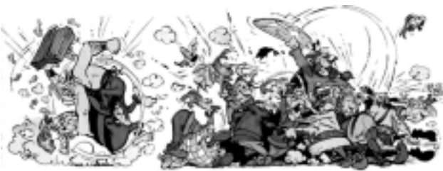
ΕΤΣΙ ΕΙΝΑΙ ΣΤΟ ΣΧΟΛΕΙΟ, ΟΤΑΝ ΚΑΝΟΥΝ ΚΑΒΓΑΔΕΣ ΜΑΘΗΤΕΣ ΚΥΠΡΙΑΚΗΣ ΚΑΙ ΠΟΝΤΙΑΚΗΣ ΚΑΤΑΓΩΓΗΣ

Τα παιδιά με αυτή την καταγωγή, δεν είναι αποδεχτά από την κοινωνία του σχολείου, αφού τους αντιμετωπίζουν σαν να είναι εγκληματίες. Σε πολλά σχολεία γίνονται καυγάδες ανάμεσα σε Κύπριους και στα παιδιά αυτά