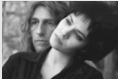
ΣΤΙΓΜΙΟΤΥΠΟ ΑΠΟ ΤΗΝ ΤΑΙΝΙΑ "Ο ΒΑΣΙΛΙΑΣ"

Σε πολλές περιπτώσεις τους φέρονται σαν σκουλήκια. Δεν μπορούν να βρουν δουλειά αλλά ούτε καν ένα μέρος να μείνουν και να ξεκινήσουν από την αρχή. Δεν τους κρίνουν από τις τωρινές τους πράξεις αλλά από το παρελθόν τους.